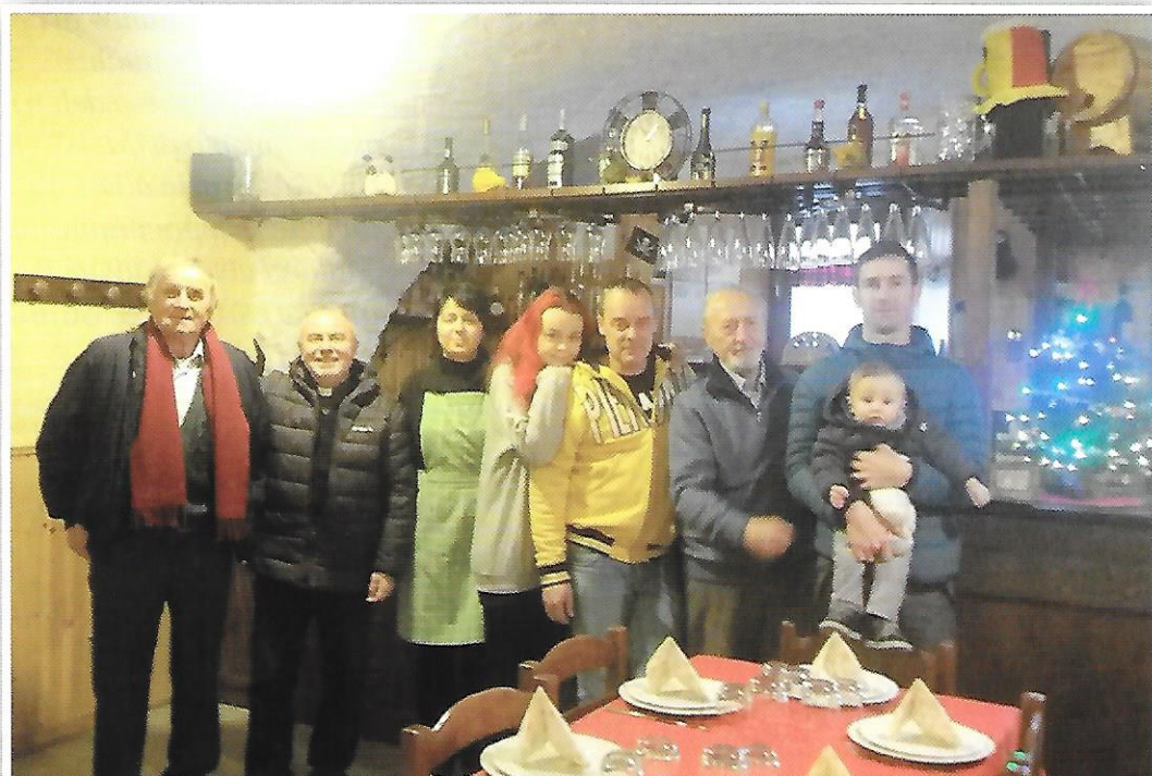
Osteria dello Zio Gil preparata per la festa di Natale con momenti di condivisione della Festa.