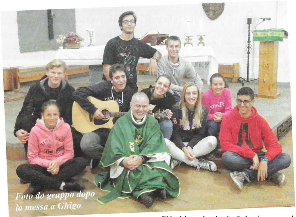
Foto do gruppo dopo la messa a Ghigo