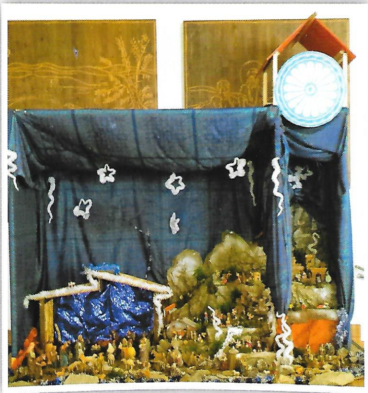
Presepe nella chiesa Mater Dei di Ghigo

I ragazzi, con il prezioso aiuto dei famigliari, hanno iniziato ad allestire, per il Santo Natale, il Presepe e preparano le prove per la recita dei bambini che si terrà il 6 gennaio prossimo.