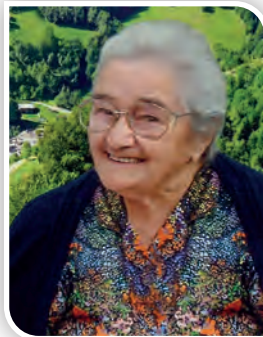
Tatà e memoria di tutta la famiglia.

* Domenica 12 dicembre ore 16 anniversario di