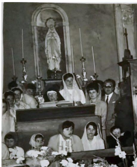
◀ Cantoria di Perrero, 1958

Se avete nei vostri archivi foto inerenti, fornitele al Vostro Don, sarà un piacere dare spazio a queste realtà che hanno fatto e fanno vivere le nostre piccole comunità.