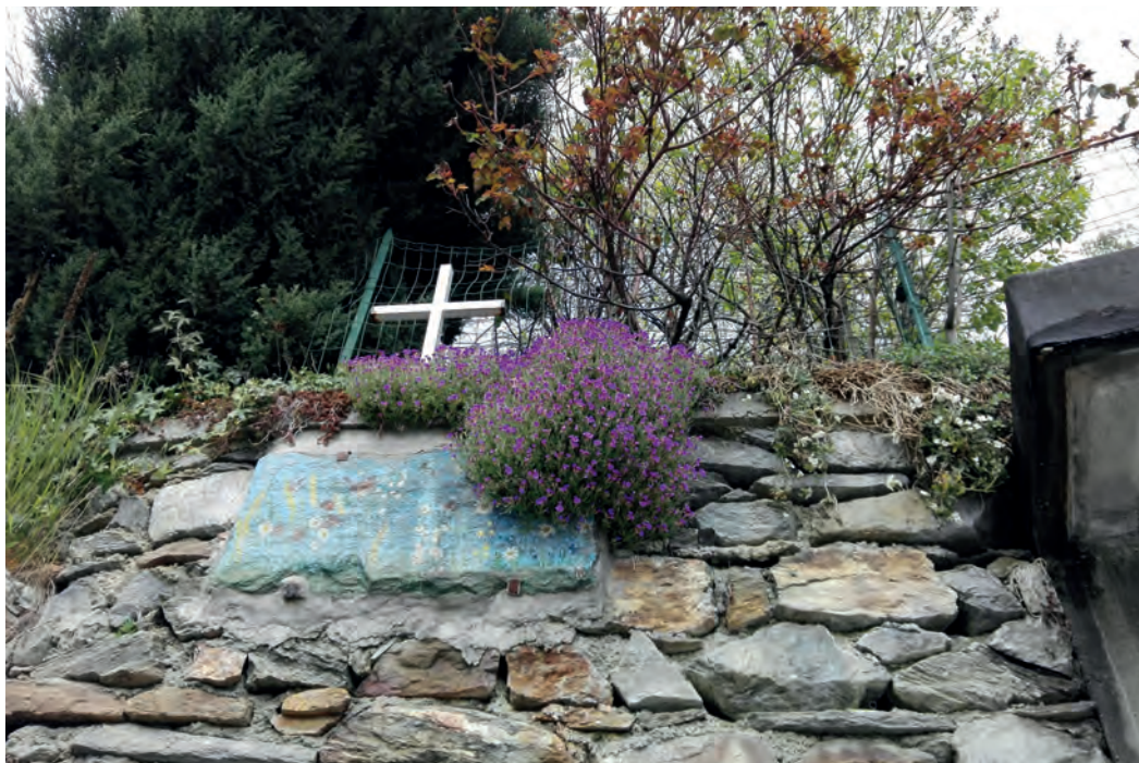
Rodoretto aspettando la neve si colora d'autunno.