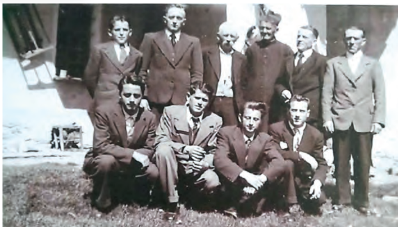
▲ Cantoria di San Martino, anno 1949