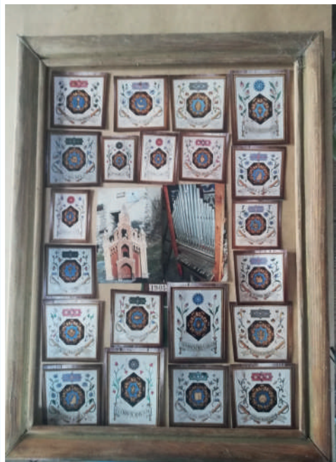
sacerdotale nella Parrocchia di San Martino e Bovile.