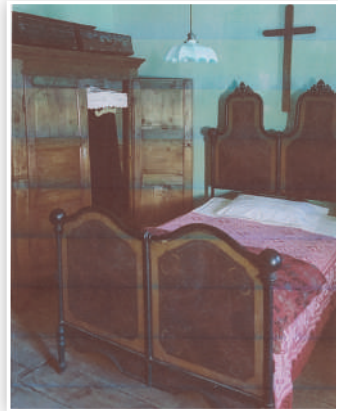
Martino e Bovile (1903-2023).